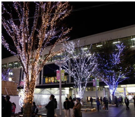
ビッグツリーページェントフェスタ in KORIYAMA（郡山市）