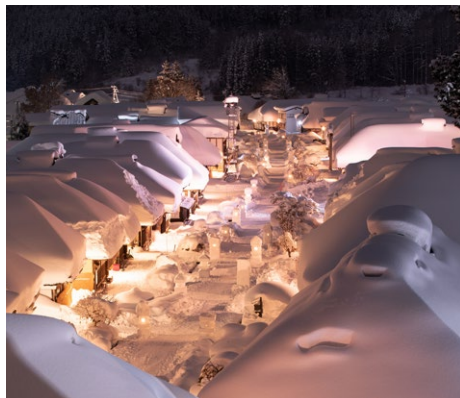
大内宿雪まつり（下郷町）