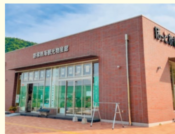
磐梯熱海観光物産館