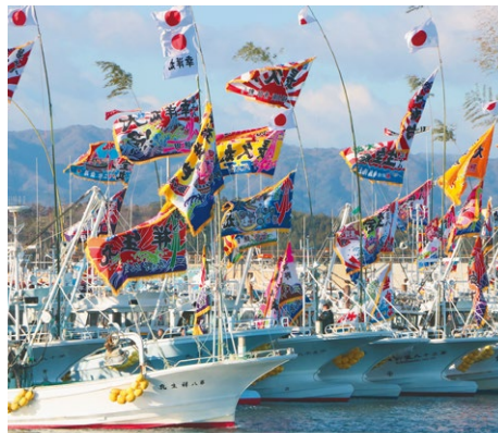
請戸漁港出初式（浪江町）